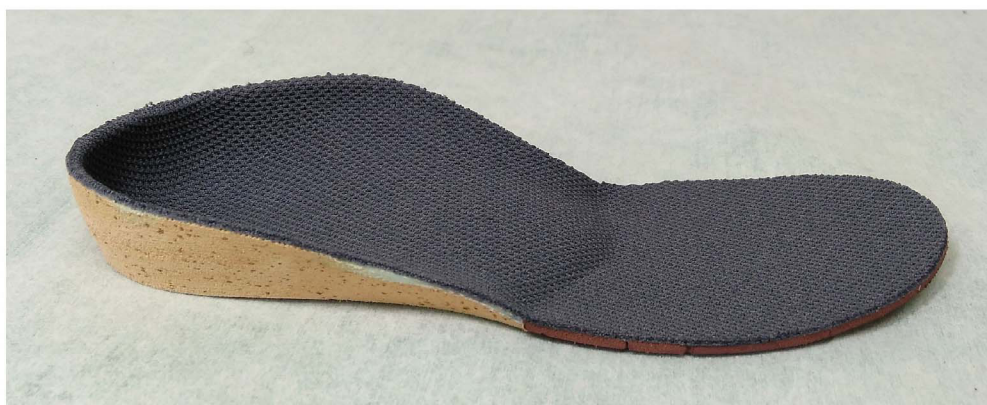
足底挿板(インソール、靴の中敷き)

ほとんどの場合、成長に伴って10～15歳までに自然に土踏まずが形成されますので、症状がなければ積極的な治療の必要はありません。痛みなどがある場合には、アーチ構造を支える足底挿板(インソール、靴の中敷き)を装着した靴をはくようにします。先天的な疾患に伴う扁平足を除き、手術が必要になることはほとんどありません。